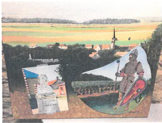
Œuvre de Dominique RIGAUDIER Paysage de Cesny aux Vignes